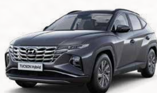
Dark Knight Gray